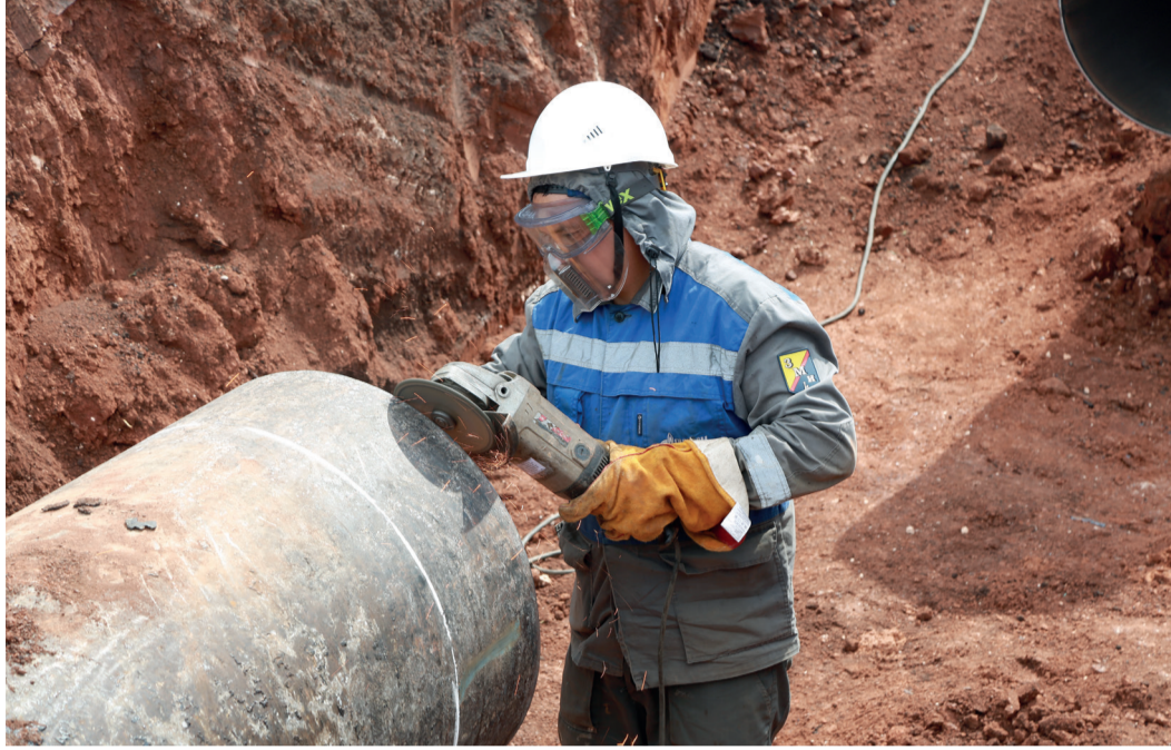
В преддверии осенне-зимнего периода предусмотрен ремонт 35 км линейной части магистральных газопроводов

Подготовка к осенне-зимней эксплуатации объектов газотранспортной системы – важная часть работы для всех предприятий Группы «Газпром». Начинается она сразу после окончания отопительного сезона.