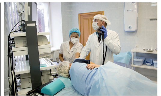
ОТ ГИМНАСТИКИ ДО ТЕЛЕМЕДИЦИНЫ стр. 8