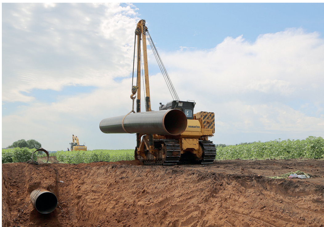
Замена трубы на магистральном газопроводе Совхозное ПХГ–Канчуринская СПХГ