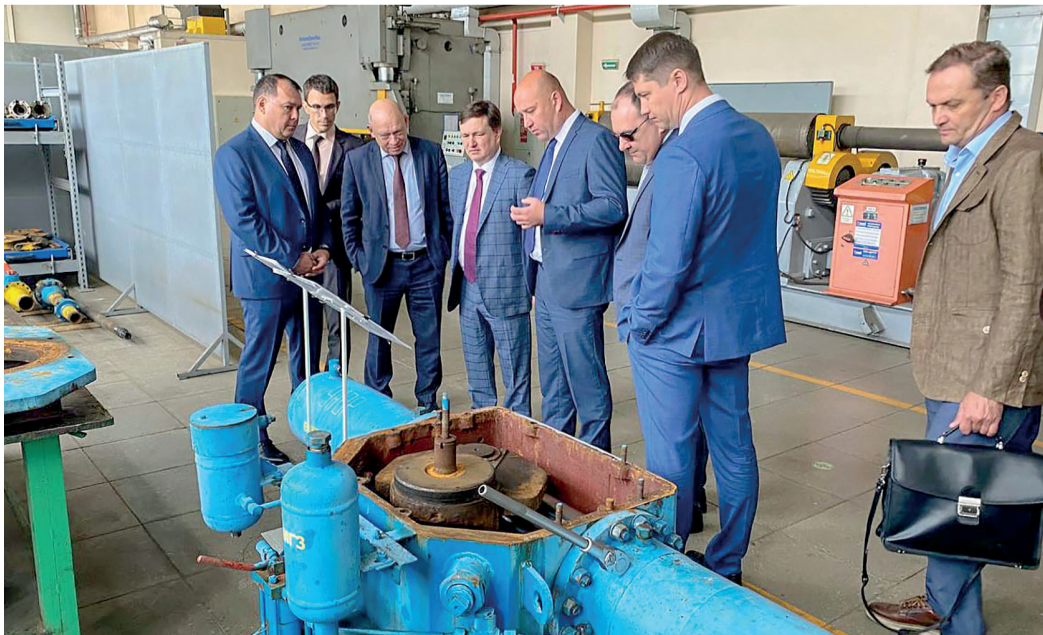
Участники совещания осматривают производственные и технологические цеха УАВР