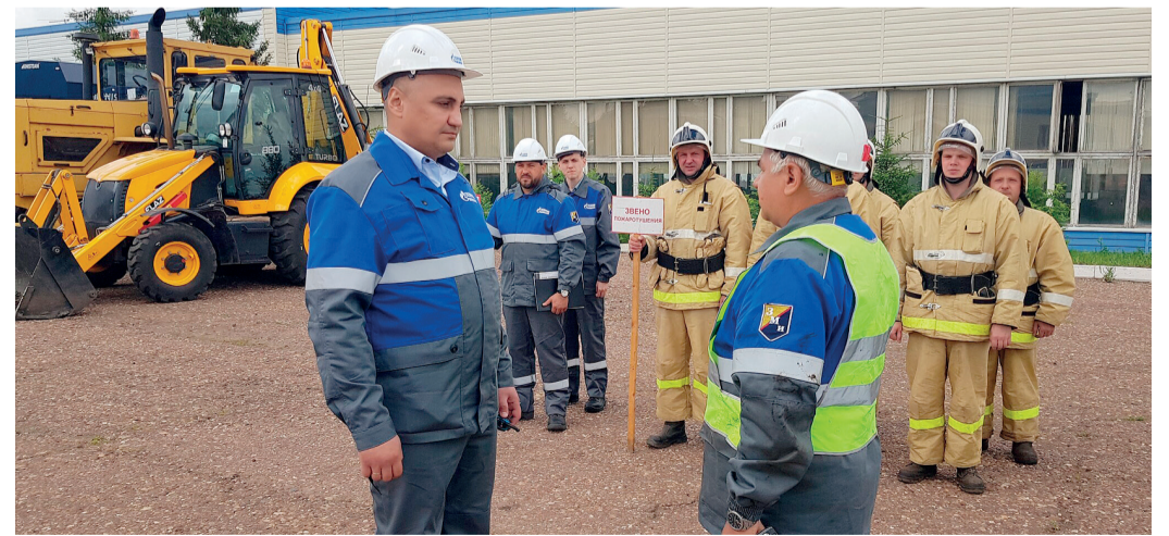
Персонал к проведению противоаварийной тренировки готов

работ по подъему специального инструмента на стальных буровых трубах произошел перелив промывочной жидкости на скважине № 277 Канчуринско-Мусинского комплекса ПХГ, что привело к возникновению «открытого фонтана». В процессе тренировки комиссия оценивала слаженность действий диспетчерских служб, аварийных бригад, специальной техники, правильность оказания первой и доврачебной помощи и иные навыки.