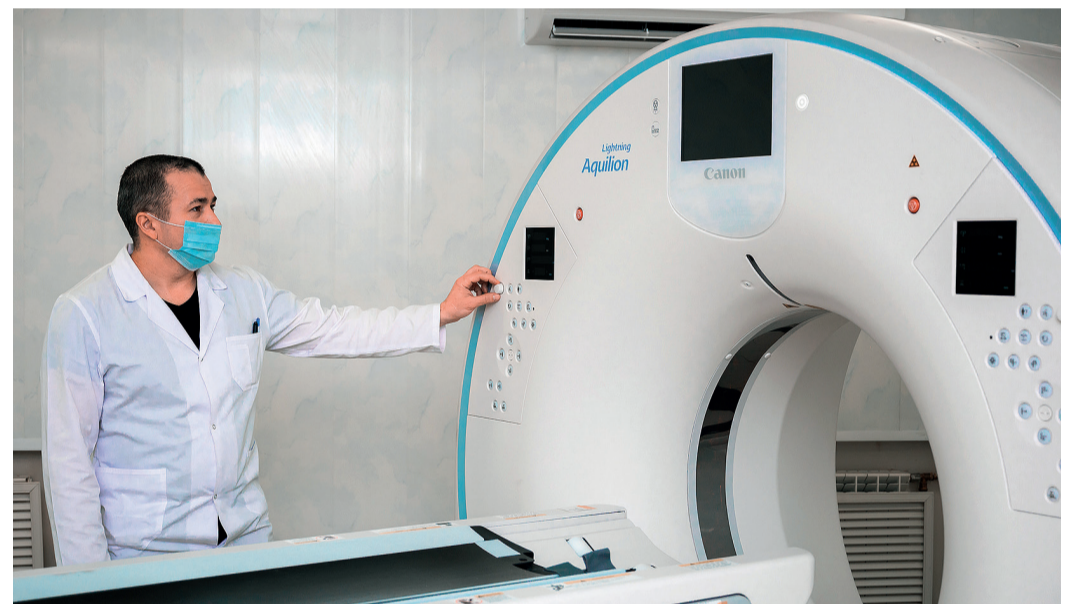
Современное оборудование – залог успешной диагностики

Участники совещания рассмотрели вопросы необходимости расширения телемедицинских технологий и обновления медицинского оборудования. На сегодняшний день диагностическое отделение ЛДЦ располагает одним из самых высокотехнологичных аппаратов в Республике Башкортостан – компьютерной системой многосрезовой спиральной томографии всего тела Canon AQUILION Lightning TSX-036. С ее запуском у работников «Газпром трансгаз Уфа» появилась возможность получения более широкого спектра диагностического обследования. В ее системе используются инновационные технологии, позволяющие минимизировать лучевую