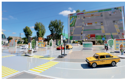
ПО ДОРОГЕ ДЕТСТВА стр. 5