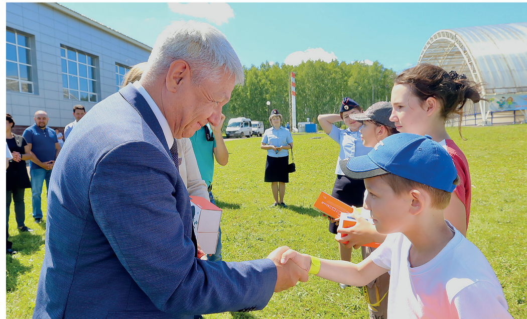
Юные участники получили ценные призы от предприятия