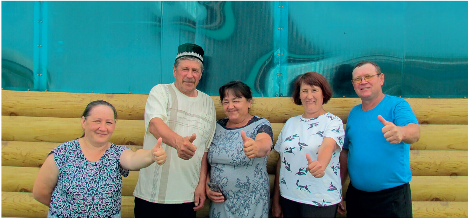
Таштюбинцы получили газ спустя четверть века

От жителей республики поступило более 25 тыс. заявок на ускоренное подключение к газовым сетям. Большинство из них, 90 %, переведены в договоры, 34 % исполнены – газовая труба доведена до границ участка.