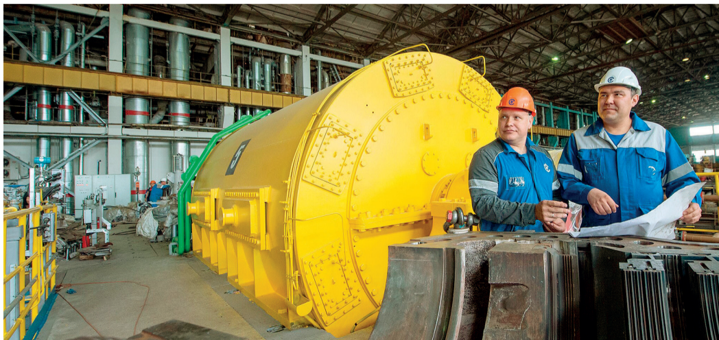
В Ново-Салаватской ТЭЦ

пловой мощности ТЭЦ, а также повышение надежности тепло- и электроснабжения нефтехимического комплекса «Газпром нефтехим Салават».