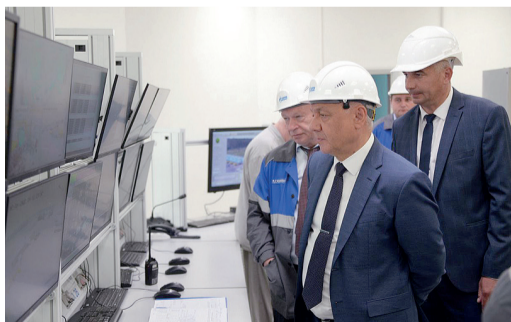
РАЗВИТИЕ В ЦИФРЕ стр. 2