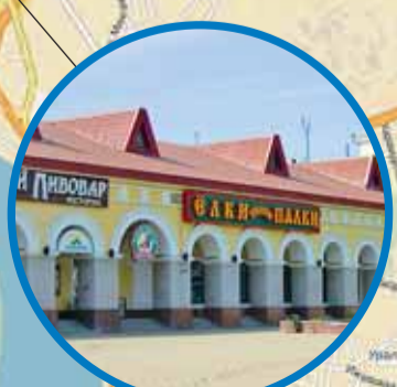
ТДК «ГОСТИНЫЙ ДВОР» Верхнеторговая площадь, 1 (Церемонии награждения)