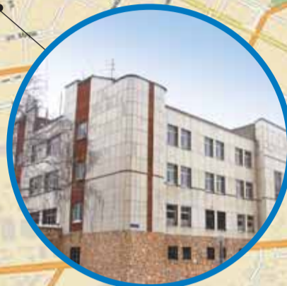
СОК УГНТУ ул. Кольцевая, 5/1