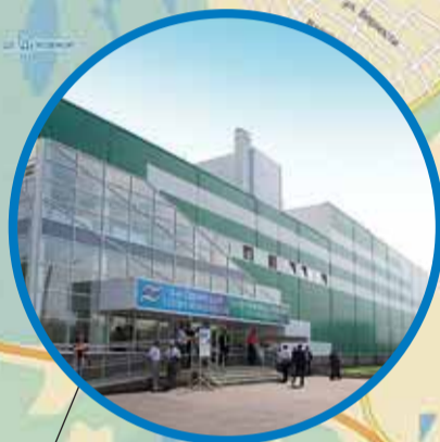
ГБОУ Республиканская школа-интернат № 5 ул. Чкалова, 110