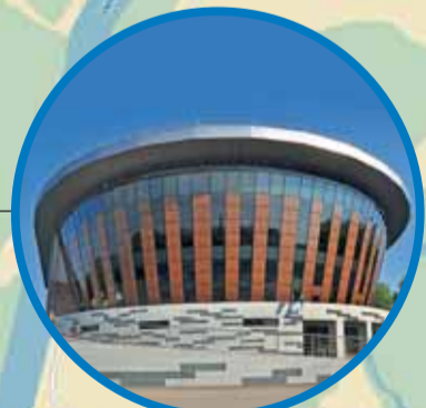
ВДНХ-ЭКСПО ул. Менделеева, 158 (Закрытие Спартакиады)