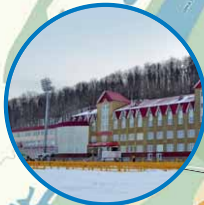
СОК «БИАТЛОН» ул. Комарова, 1