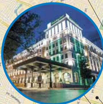
гостиница «Холидей Инн» Верхнеторговая площадь, 1 (Пресс-центр)