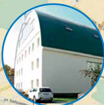
СОК БГАУ ул. 50-летия Октября, 34