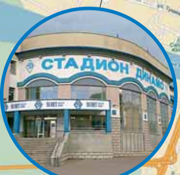
СК «ДИНАМО», ул. К. Маркса, 2