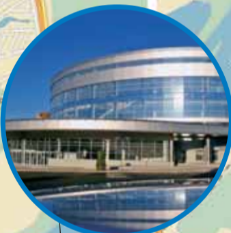
УСА «УФА-АРЕНА» ул. Ленина, 114 (Открытие Спартакиады)