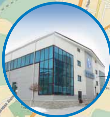
СОК «ВИТЯЗЬ» ул. Сипайловская, 11 (в т.ч. Штаб и Главная судейская коллегия)