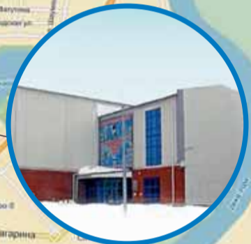
ДЮСШ № 32 ул. Б. Бикбая, 13