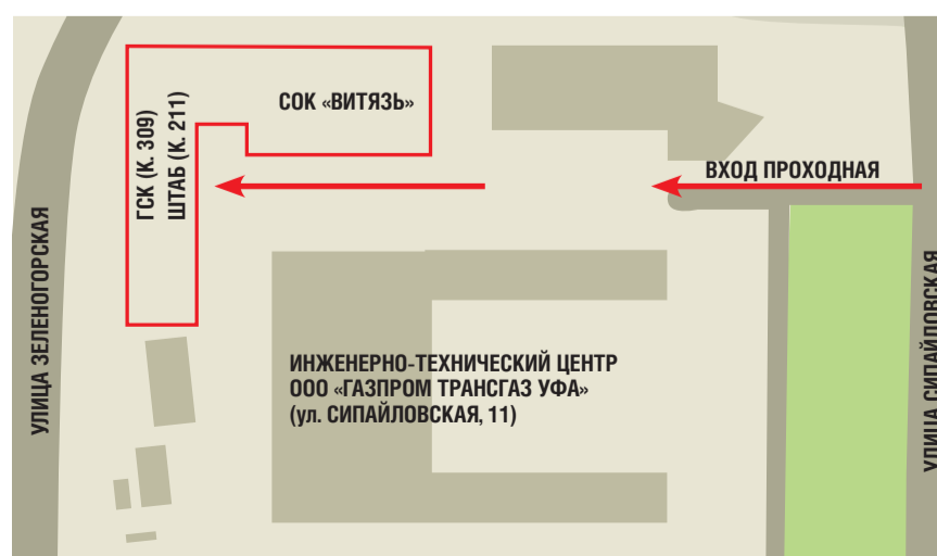
СХЕМА РАЗМЕЩЕНИЯ ШТАБА И ГЛАВНОЙ СУДЕЙСКОЙ КОЛЛЕГИИ СПАРТАКИАДЫ