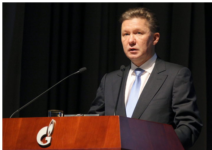
Алексей Миллер обозначил перспективы развития компании