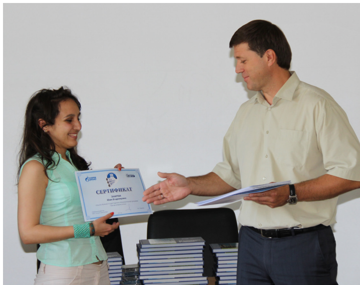
Сертификаты для молодых специалистов

Что делать, если работа перестала приносить былой интерес? Как справиться с накопившимися стрессами и не чувствовать себя как «выжатый лимон» к середине дня. Обо всем этом молодые специалисты ООО «Газпром трансгаз Уфа» узнали на третьем модуле адаптационно-образовательной программы «Три магистрали успеха».