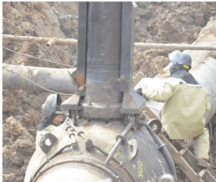
Работы в Поляском ЛПУМГ шли полным ходом