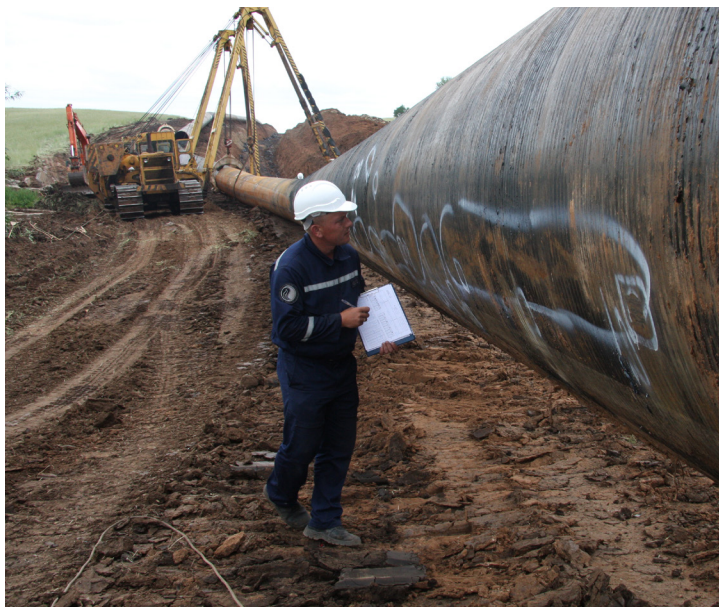
В сентябре участок Шаранского ЛПУМГ будет введен в строй

ООО «Газпром трансгаз Уфа» активно выполняет ремонтные работы в рамках комплекса «Сургутский». Именно так называется ежегодная масштабная серия работ, выполняемых одновременно несколькими дочерними обществами «Газпрома» по системам газопроводов Уренгой–Сургут–Челябинск–Петровск. В цехах компрессорных станций и на трассе газопроводов усилия газотранспортников сосредоточены на одном из важнейших направлений поставок газа в центральную часть России и его экспорта в Европу.