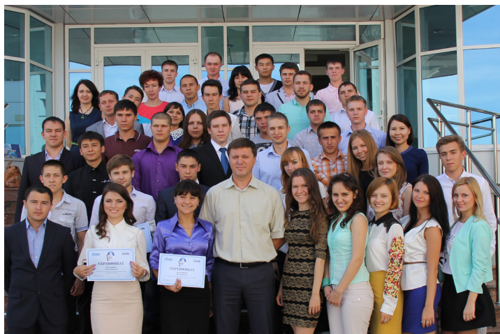
Молодежь, пришедшая на предприятие в 2013 году