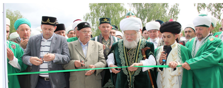
Верховный муфтий открывает мечеть

При поддержке ООО «Газпром трансгаз Уфа» в селе Верхние Татышлы Республики Башкортостан открылась новая мечеть.