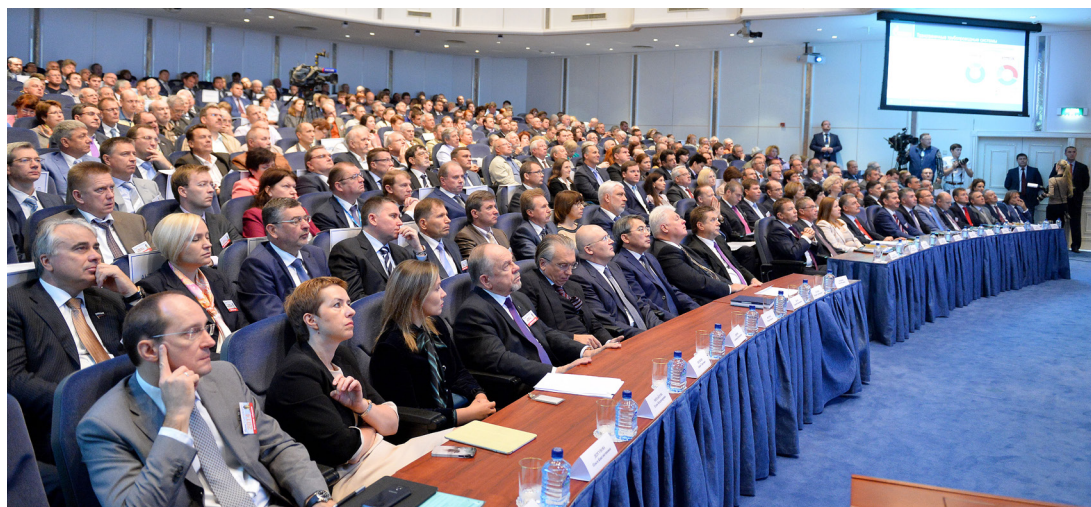
Участники годового общего собрания

В Москве состоялось годовое общее собрание акционеров ОАО «Газпром».